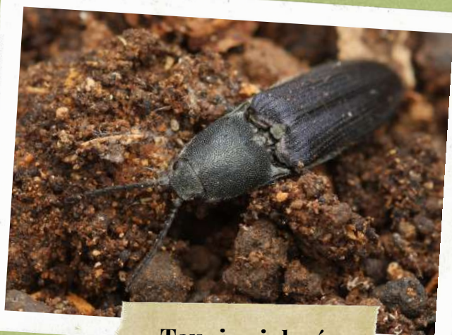
Taupin violacé Limoniscus Violaceus

“ A travers cette acquisition, c'est également tout un écosystème qui est protégé : ainsi, ce bois abrite une population de coléoptères en danger d'extinction en Europe. En préservant cette forêt, nous permettons à cette espèce, mais aussi à de nombreuses autres, de continuer à vivre et à se développer au sein de cet espace.